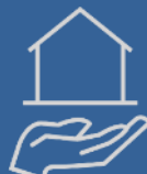
premie beschermde afnemer