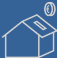
huur- en isolatiepremie