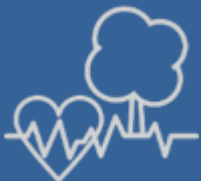
gezondheid welzijn rust