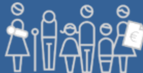
(groot) gezin - geld