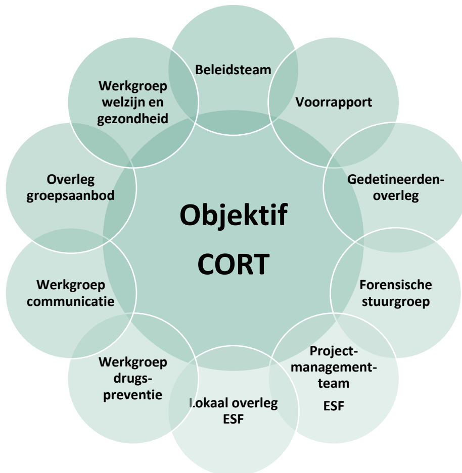
Figuur 1: Overlegstructuur gevangenis Mechelen 2023 17

Hieronder vind je de verschillende overlegstructuren binnen de gevangenis Mechelen waarbij de hulp- en dienstverlening betrokken is. De verschillende werkgroepen en overlegstructuren staan telkens met elkaar in verbinding en wisselen informatie uit. Naar aanleiding van het nieuwe actieplan en de doelstellingen die we hierin willen verwezenlijken wordt deze overlegstructuur herbekeken.