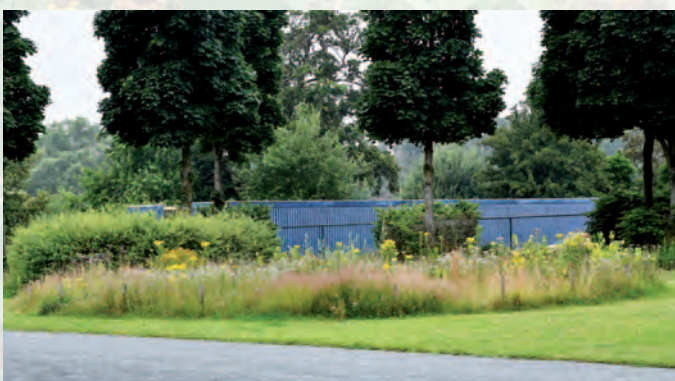
Zoersel | Bijenvriendelijke plantenpakketten