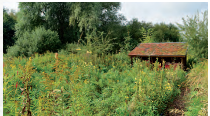
Zedelgem | Bloemenmengsels en bloeiende bijenplanten