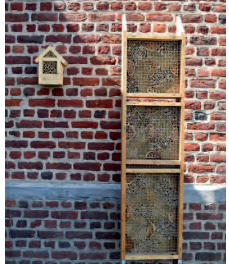
Overijse | Altijd Week van de bij