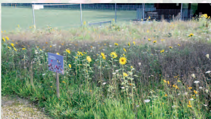
Erpe-Mere | Erpe-Mere draagt zorg voor de bestuivertjes