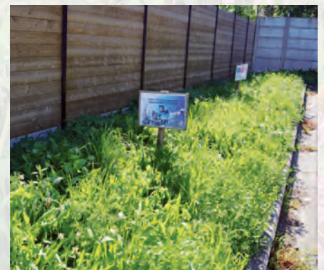
Meulebeke | Bijenvriendelijk Meulebeke