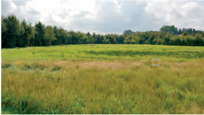
Jabbeke | Bijenvriendelijke gemeente