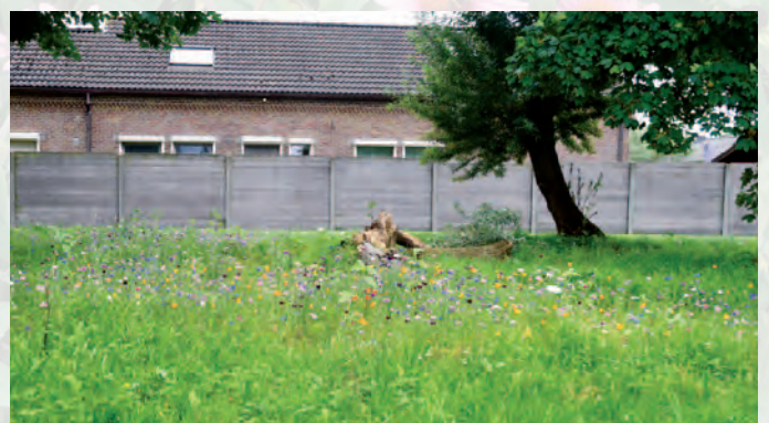
Stekene | Blij voor de bij