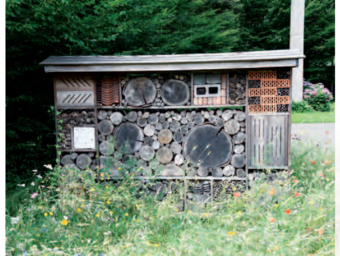
Beveren | Bloemenweides op diverse locaties