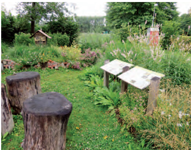
Bonheiden | Bonheiden bijenvriendelijk