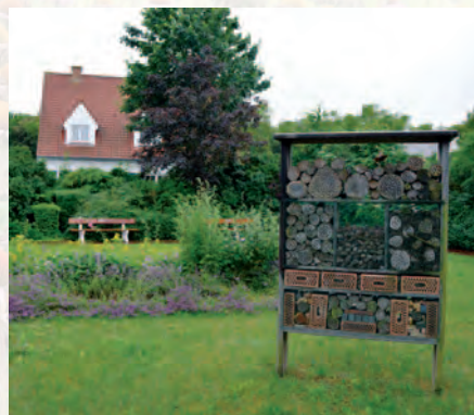
De Panne | Voer de bij bij