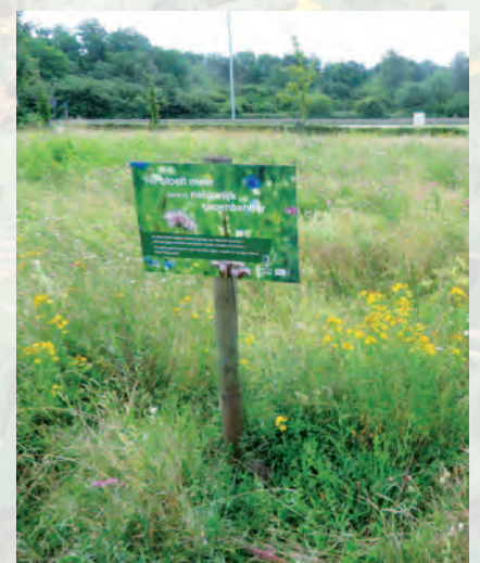
Genk | Bijenvriendelijk Genk