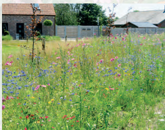
Torhout | Bijenvriendelijke stad