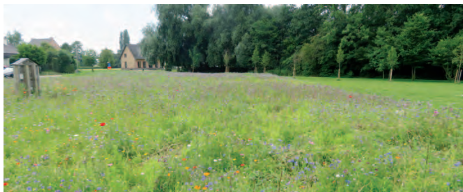
Alken | Bijenvriendelijke aanplant