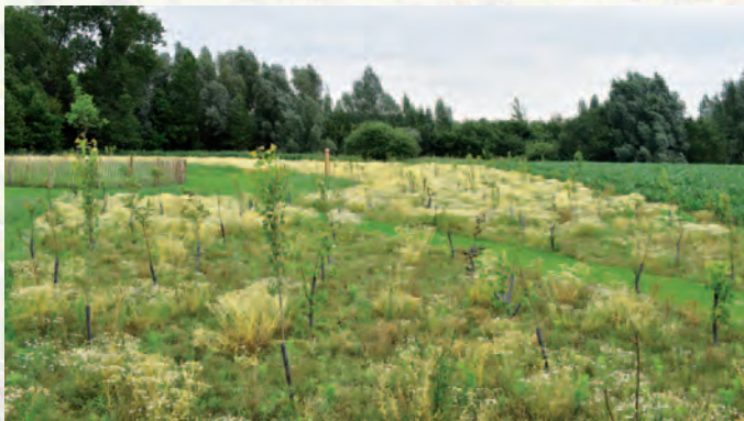
Kruikeke | Tijdelijke natuur