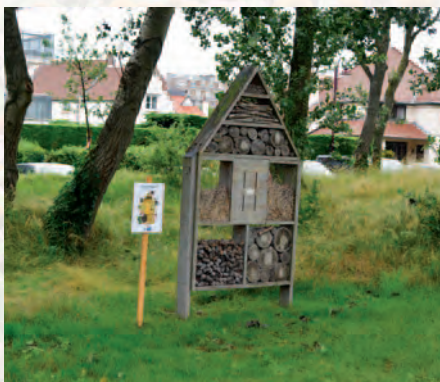
De Haan | Bijenvriendelijke gemeente