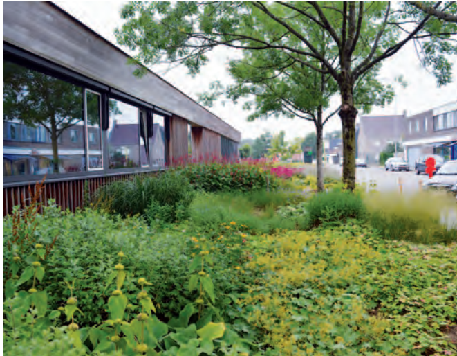
Beernem | #BijBeernem