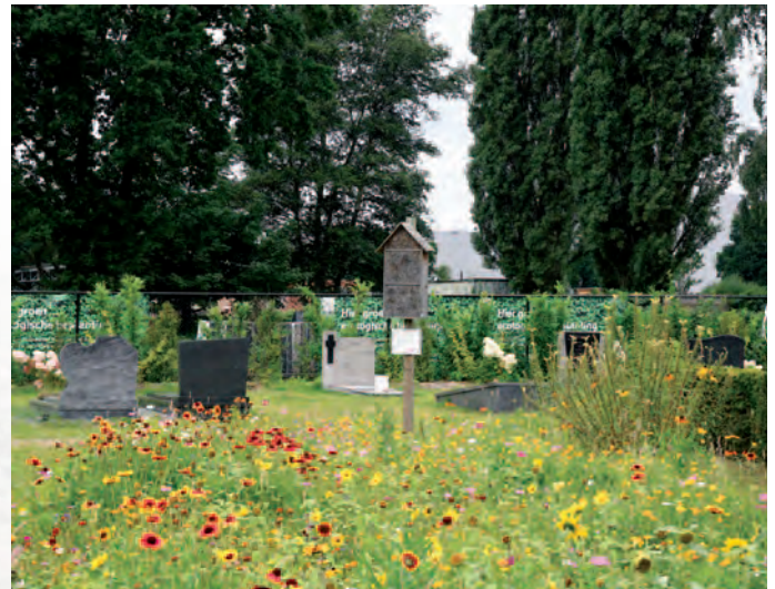
Rumst | Bijenvriendelijk groen en bloemenweides