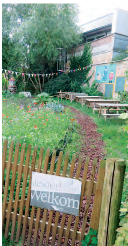
Antwerpen-Borgerhout | Bijenvriendelijk Borgerhout