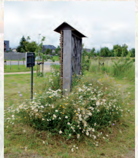
Bredene | Themapark Bijen