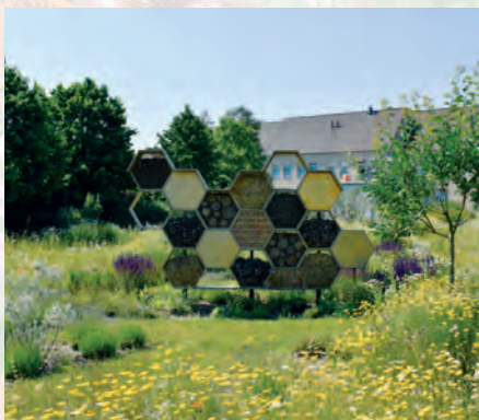
Machelen | Machelen-Diegem zoemt