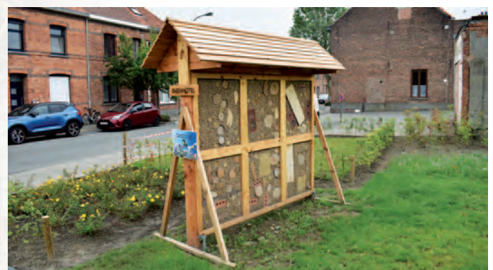
Zwijndrecht | Bijenhôtels en bijenvriendelijke aanplantingen