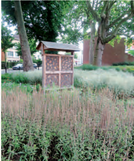
Antwerpen-Hoboken | Hobokense biekes