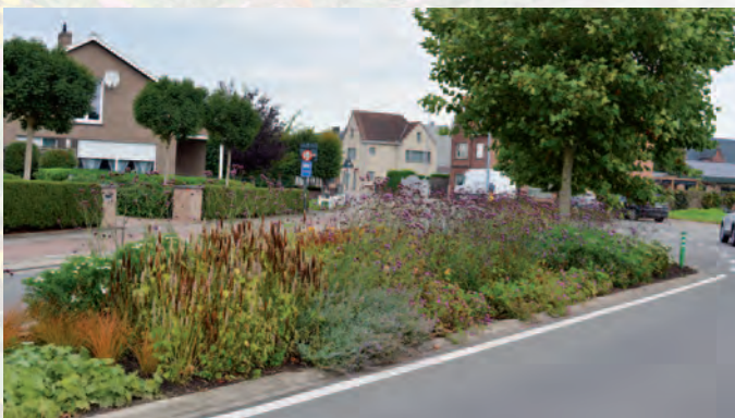
Wingene | Wingene in de bres voor bijen