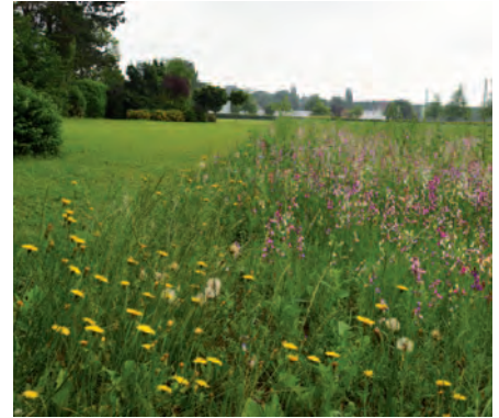
Waregem | Bloemenweides