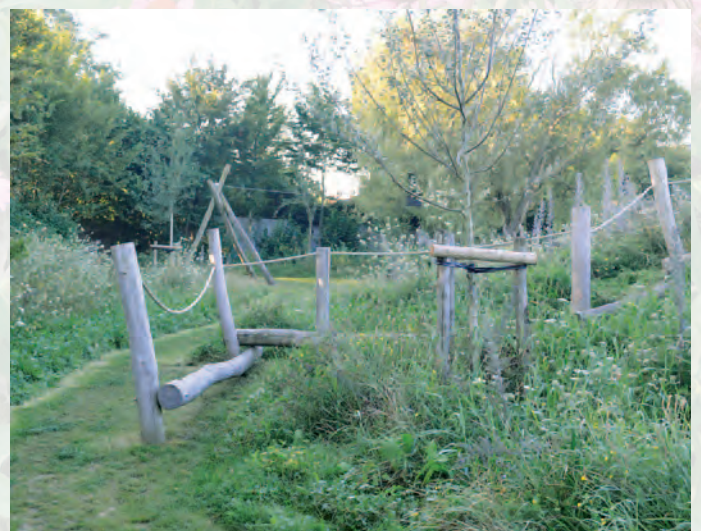
Hooglede | Bezige bijtjes