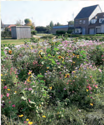
Avelgem | Bijenvriendelijk Avelgem