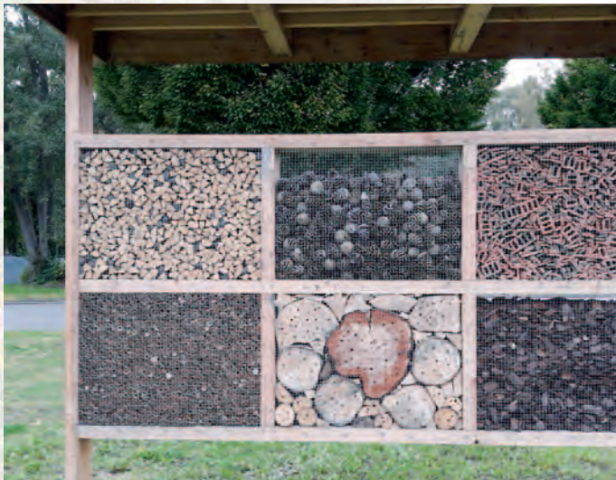
Oudenaarde | Bijenaarde