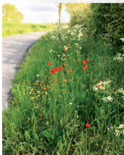
Diksmuide | Zoemrijk Diksmuide