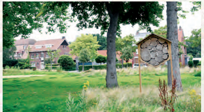
Lint | Bijen- en insectenvriendelijk