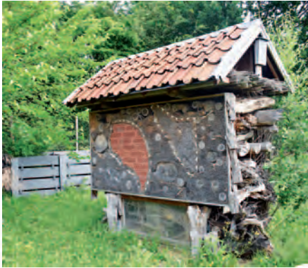
Temse | Zoemrijk Temse