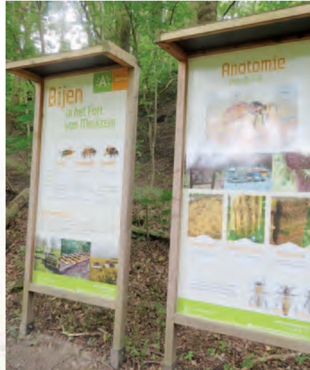
Antwerpen-Merkssem | Bijenvriendelijk Merkssem