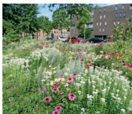
Antwerpen-Berchem | Berchemse bijen