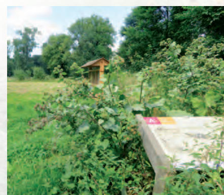
Antwerpen-Berendrecht-Zandvliet-Lillo | Bijenvriendelijk