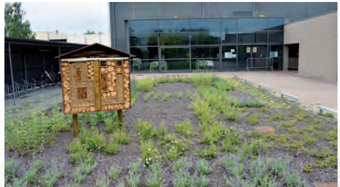
Buggenhout | Vlinder- en bijentuin aan de Orangerie