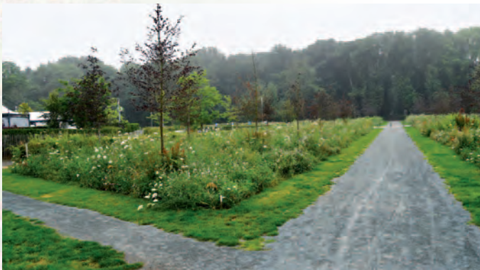
Wijnegem | Bloemenweelde