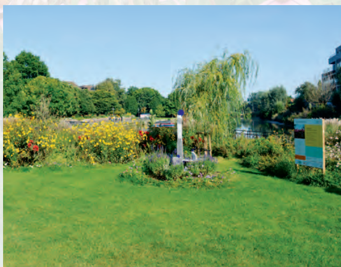
Roeselare | Wild van bijen