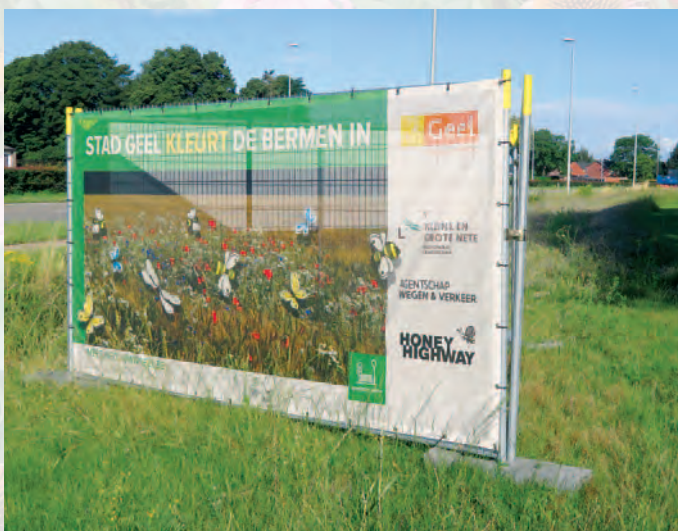
Geel | Geel komt op voor de bijen