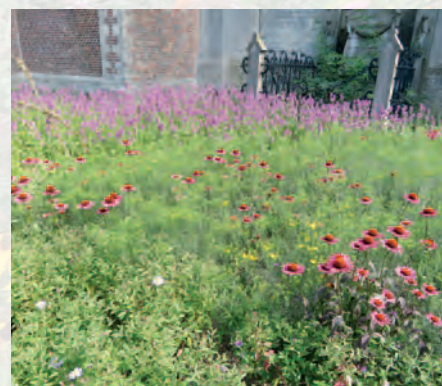
Antwerpen-Ekeren | Bijenvriendelijk Ekeren