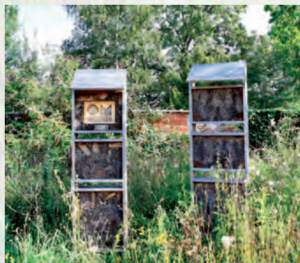
Mechelen | Bijenvriendelijke stad