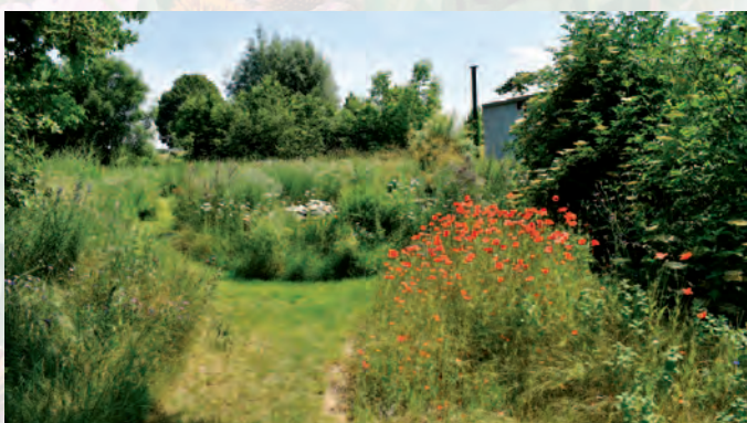
Steenokkerzeel | Bijenvriendelijk Steenokkerzeel