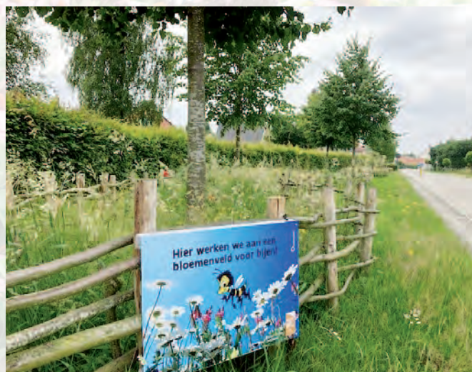
Oosterzele | Bijenhal Oosterzele