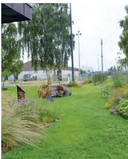
Damme | Bijenwerking Damme