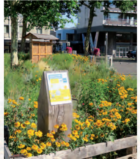
Antwerpen-Wilrijk | WIBI - Wilrijkse Bij