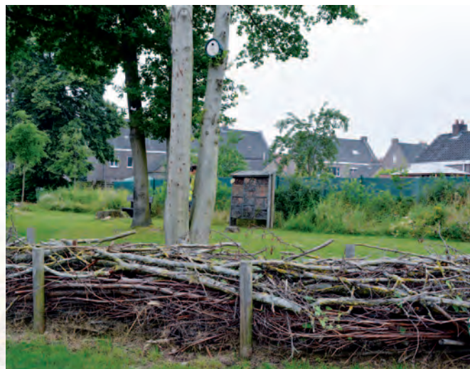
Harelbeke | Harelbijke