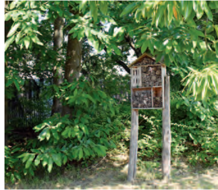
Vilvoorde | Bijenvelden