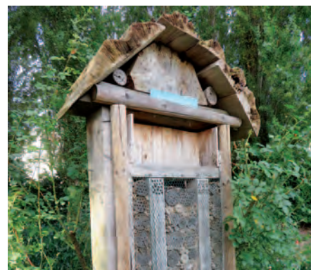
Antwerpen-Antwerpen | Bloemenweides