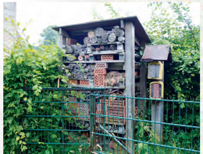
Brugge | Brugge, bijenvriendelijke stad