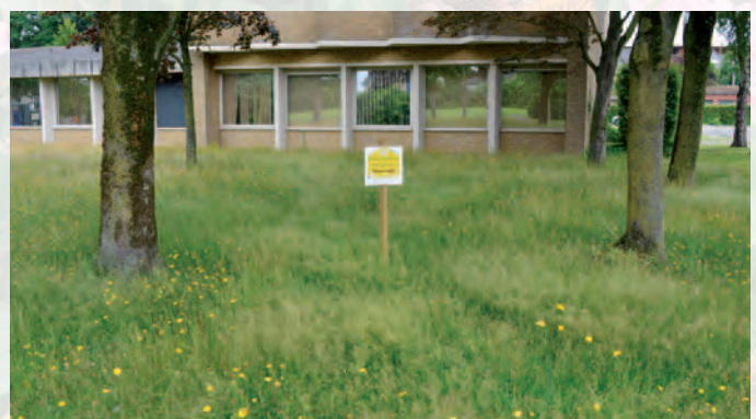
Ichtegem | Ichtegem zoemt!