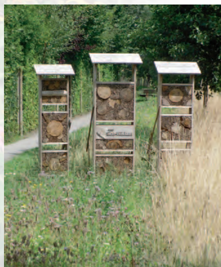
Sint-Niklaas | Brasserie Honingdauw