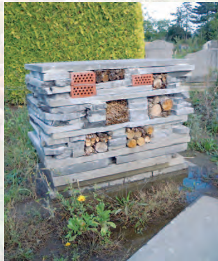
Berlaar | Bloeiend Berlaar