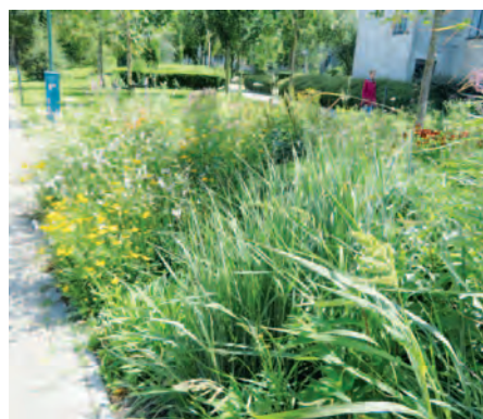
Antwerpen-Deurne | Deurnse bijen