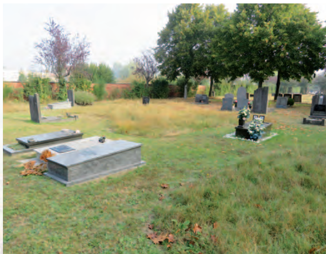
Gent | Bijenvriendelijke stad