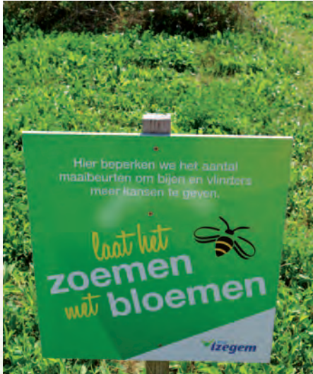
Izegem | Izegemse bijenroute