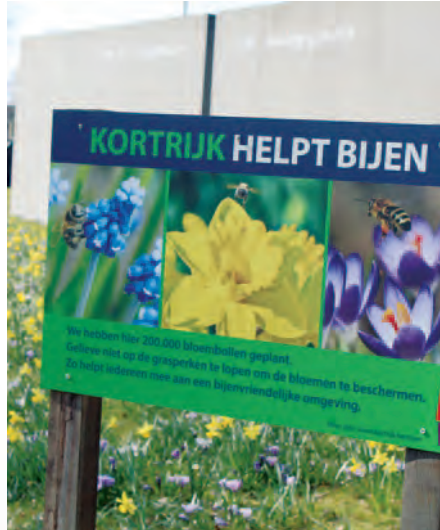
Kortrijk | Bijenvriendelijk Kortrijk