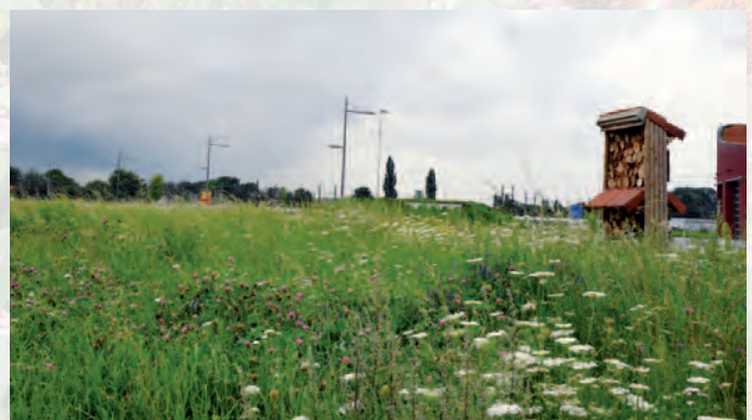
Duffel | Een paradijs voor bijen