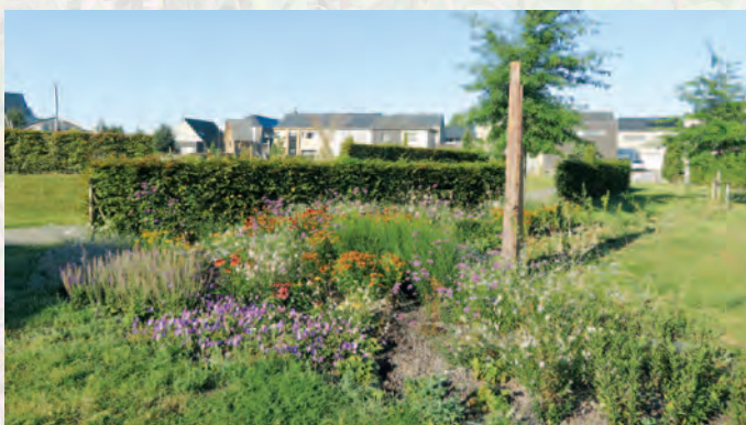
Denderleeuw | Bijen in het Broekpark