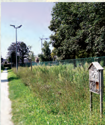
Sint-Katelijne-Waver | Bij-zondere gemeente