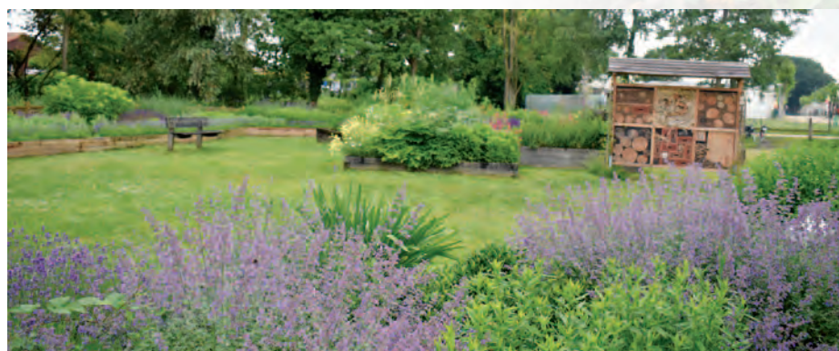
Berlare | Een thuis voor de bij