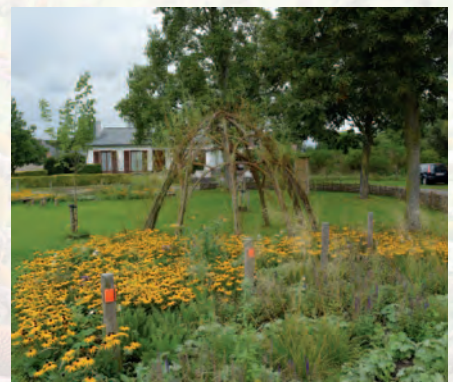
Eeklo | Bijenvriendelijke aanplantingen