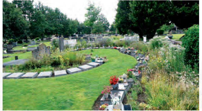
Kontich | Kontich zoemt er op los