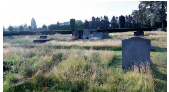
Willebroek | Willebroek bijengemeente