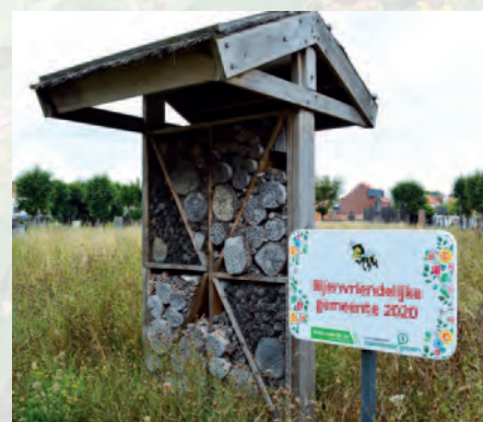
Blankenberge | Bijtjesberge