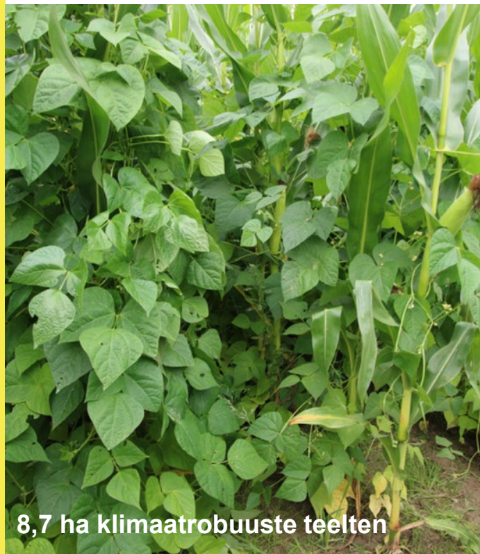
8,7 ha klimaatrobuuste teelten