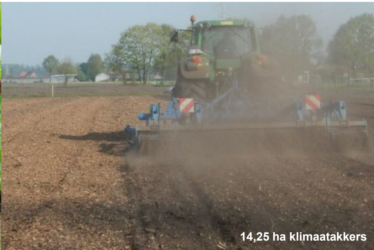
14,25 ha klimaatakkers