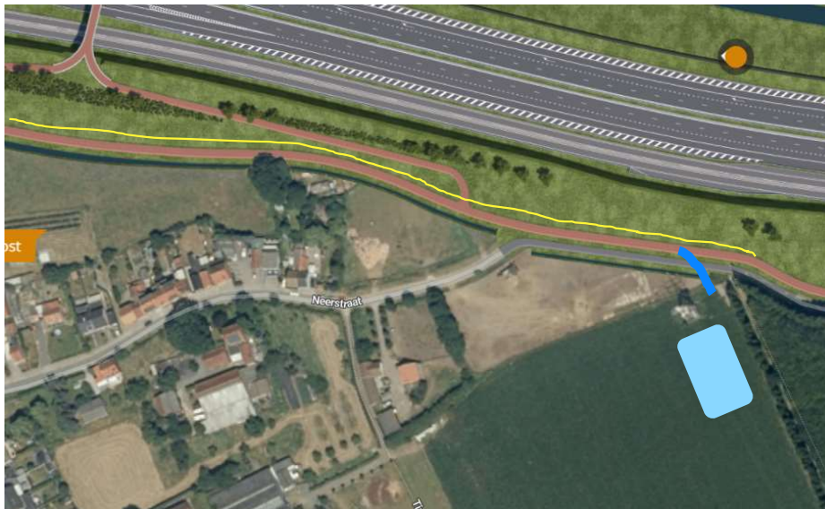
Ontsluiting zone werfinrichting & TOP