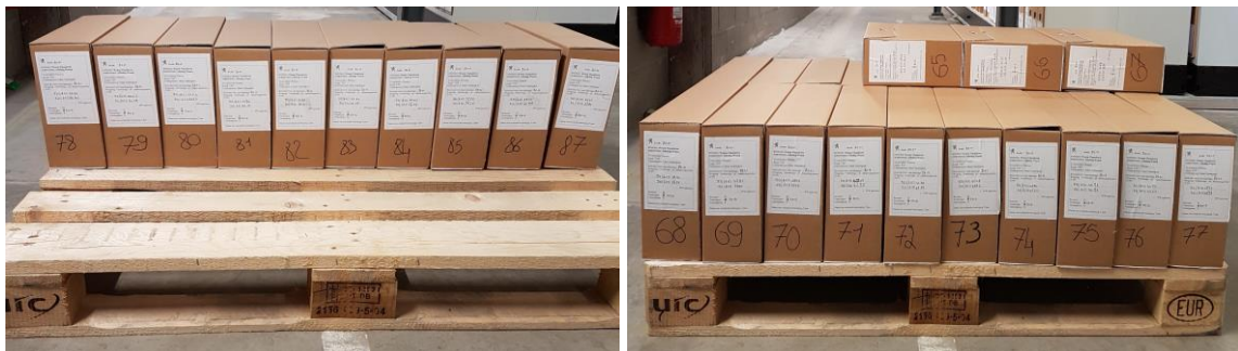
Foto 1 en 2 : stapelen van de archiefdozen op de eerste en tweede rij.

De volgende drie dozen komen helemaal vooraan (foto 3, nrs. 64, 63 en 62). Vervolgens leg je de drie laatste dozen naar de buitenkant toe (foto 3, links) om het totaal van 9 dozen op de horizontale tweede rij te vervolmaken.