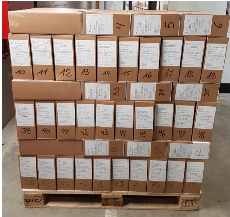
Foto 4: stapel maximaal 6 rijen archiefdozen. Omwikkel daarna de dozen met krimpfolie.