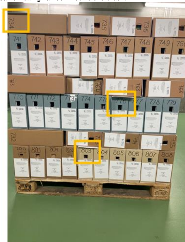
Foto 6: de gele vierkanten duiden een onderscheid door een samenvatting aan op een gestapeld pallet. Achter de eerste samenvatting (geel vierkant) zit een overdracht met bestemming vernietigen. De volgende samenvattingen (gele vierkanten) hebben bestemming bewaren.