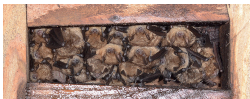
Een kolonie vleermuizen vindt hun plek in een houten dakconstructie

Kies voor permanente voorzieningen, zoals een ongevoegde spleet in snelbouwsteen. Er zijn ook vleermuiskasten in de vorm van een baksteen, die je tussen je andere stenen kan metsen. Werk met materialen uit hout, enkele balken zijn al voldoende. Je hoeft deze niet in de stal iets te voorzien, dit kan perfect in de opslagloods.