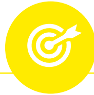
ABB bouwt mee aan DUURZAAM en DEMOCRATISCH samenleven in DIVERSITEIT door burgers en bestuur te VERBINDEN en te VERSTERKEN